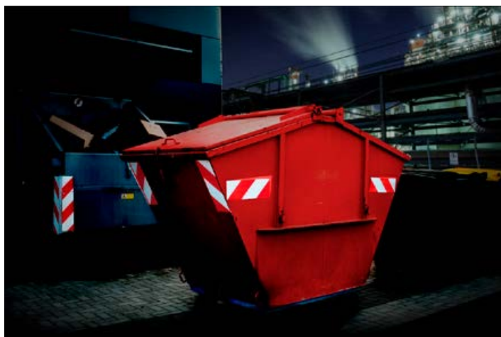
Chevrons réfléchissants Blanc/Rouge Avery Dennison® pour le marquage de conteneur.

* Notez qu'une autorisation spéciale est requise pour utiliser les bandes fluorescentes jaunes/rouges sur les véhicules d'urgence.