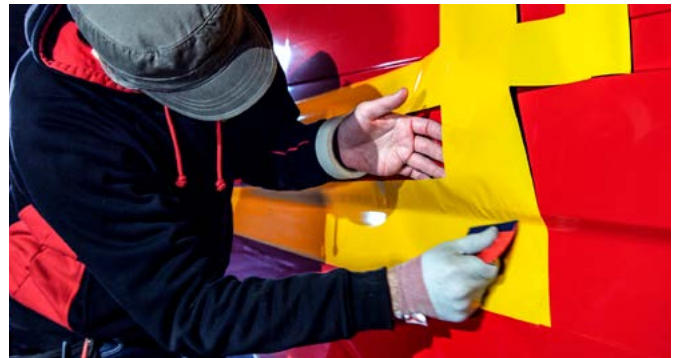
Avery Dennison V-4000 con Easy Apply RS para una rápida y fácil aplicación.