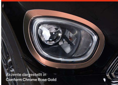
Akzente dargestellt in Conform Chrome Rose Gold

Bringen Sie Ihr Design mit effektvoll spiegelnden Chrome Details zum Glänzen!