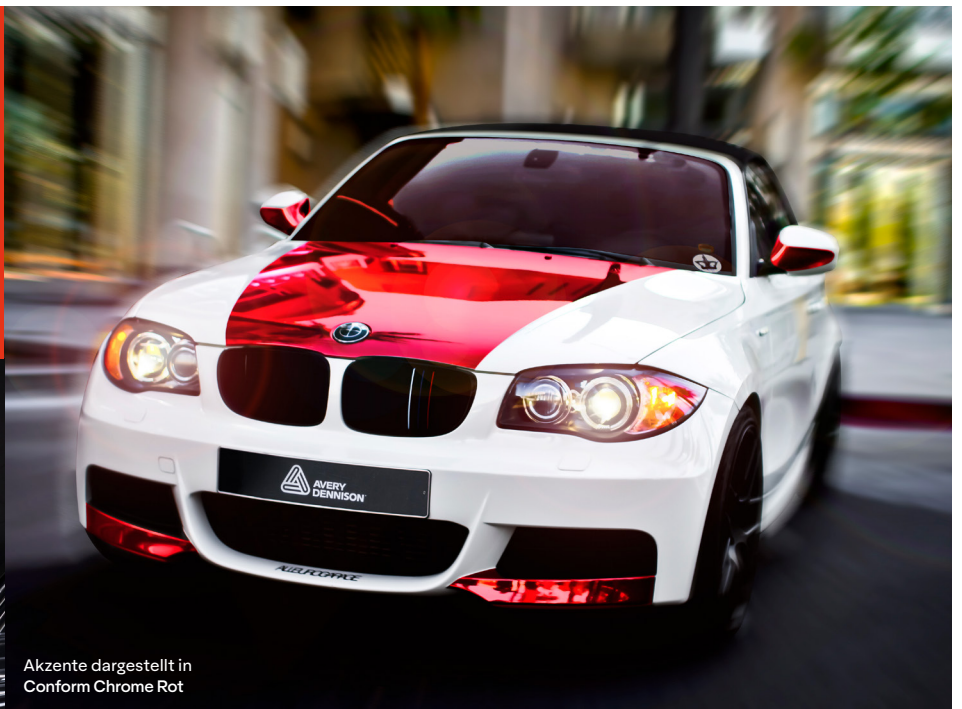
Akzente dargestellt in Conform Chrome Rot

Der Benutzer ist bezüglich der Eignung des Produktes für die geplante Anwendung selbst verantwortlich. Dieses Produkt ist auf Test- und Bestätigungsgrundlage zu verwenden. In einigen Ländern können gesetzliche Bestimmungen oder Vorschriften zur