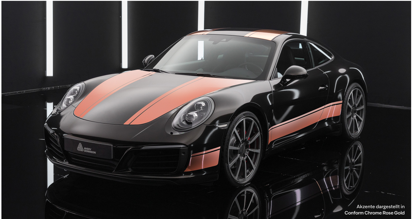
Akzente dargestellt in Conform Chrome Rose Gold